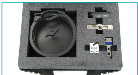
Erweiterungssatz / Add-on kit 2,5 mm 2

meters can be set automatically and correctly by changing the crimping inserts. The modular structure combined with maintenance-free and wear-free components guarantees an extreme reliability of these machines.